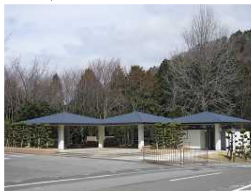
(5区バス停・休憩所)

年末年始も開園しご自由にお参りしていただけますが、窓口業務(霊園事務所を含む。)は休みとなります。