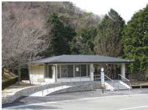
(6区バス停・休憩所)